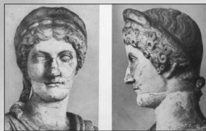
Ritratto di Agrippina Maggiore, Museo A. Salinas, Palermo