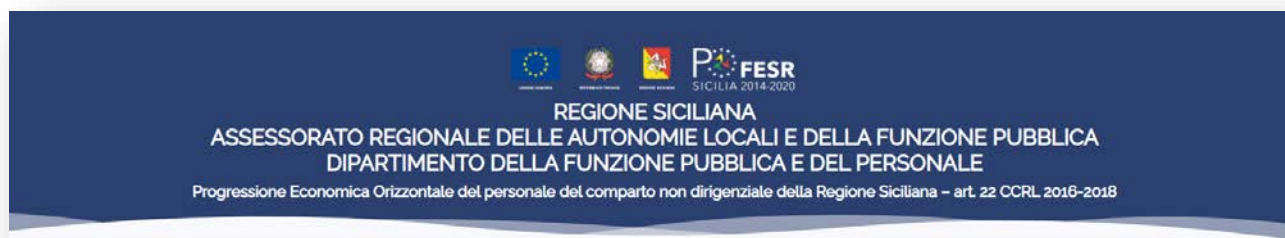
Figura 1 - Home SiciliaPEI - PEO

La piattaforma è raggiungibile dalla url https://siciliapei.regione.sicilia.it/peo