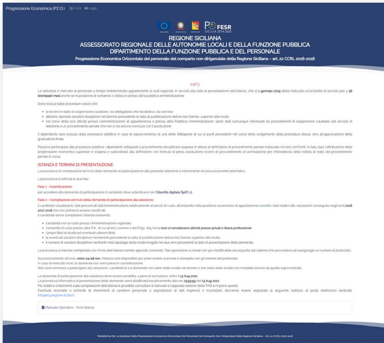
Figura 3 - Home Page PEO

Al termine dell'attesa, il sistema, rimanda alla home page della piattaforma PEO in automatico e si potrà procedere alla compilazione della domanda.