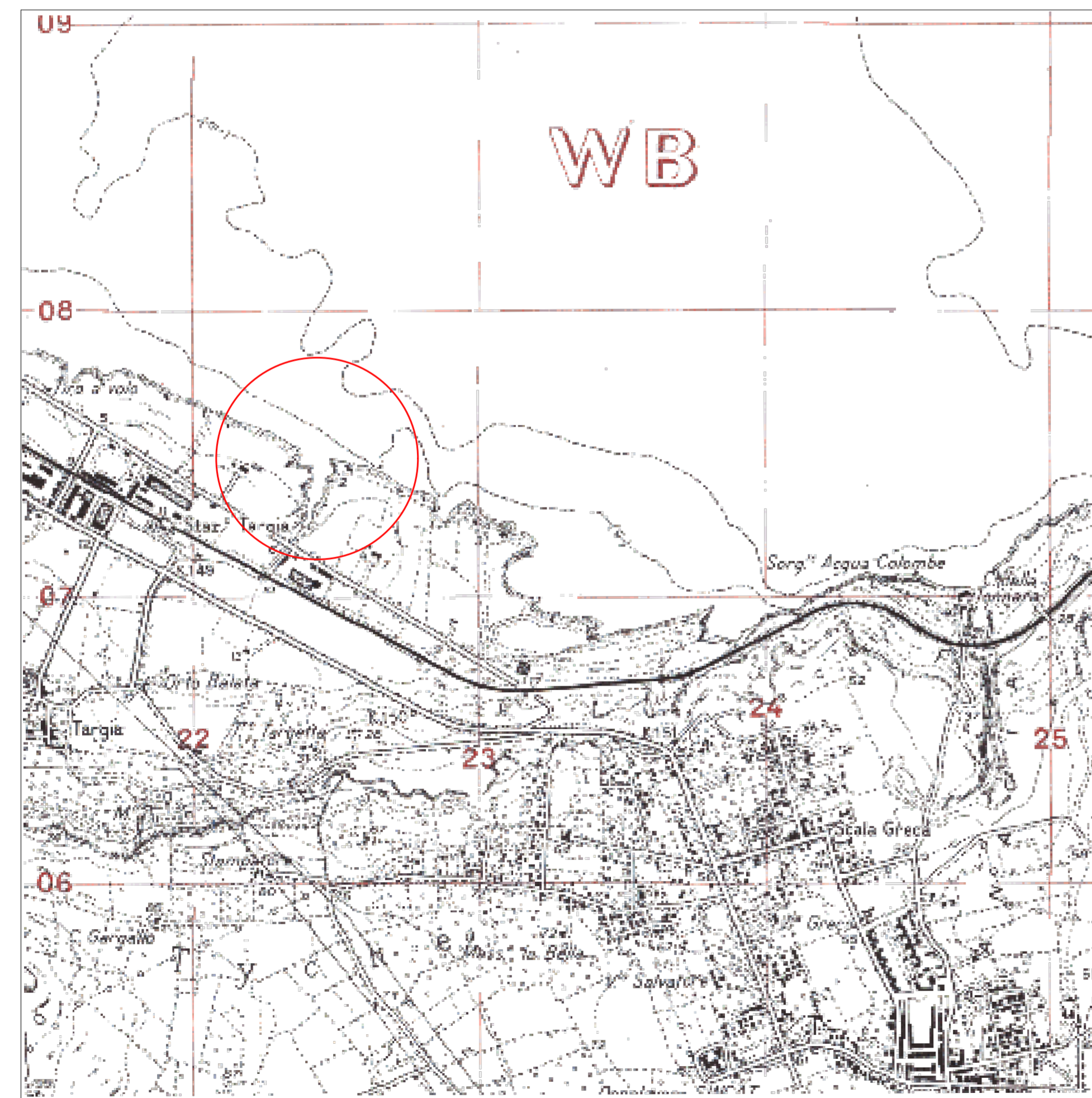
CARTA TOPOGRAFICA DI DETTAGLIO