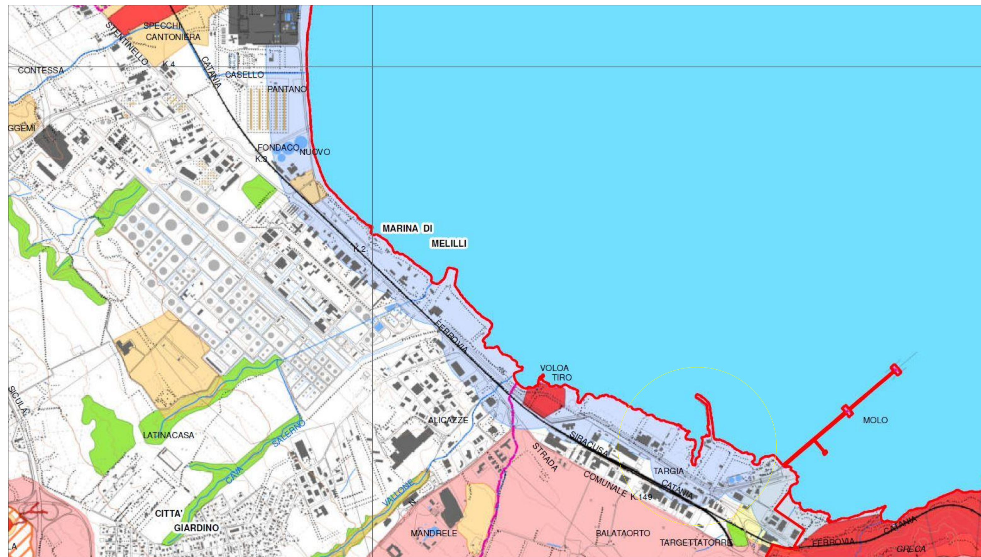
CARTA DEI VINCOLI