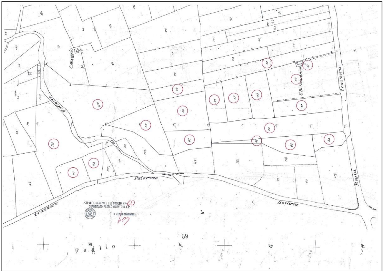
Figura 3 stralcio Fig. 69 del Comune di Sambuca di Sicilia (AG)