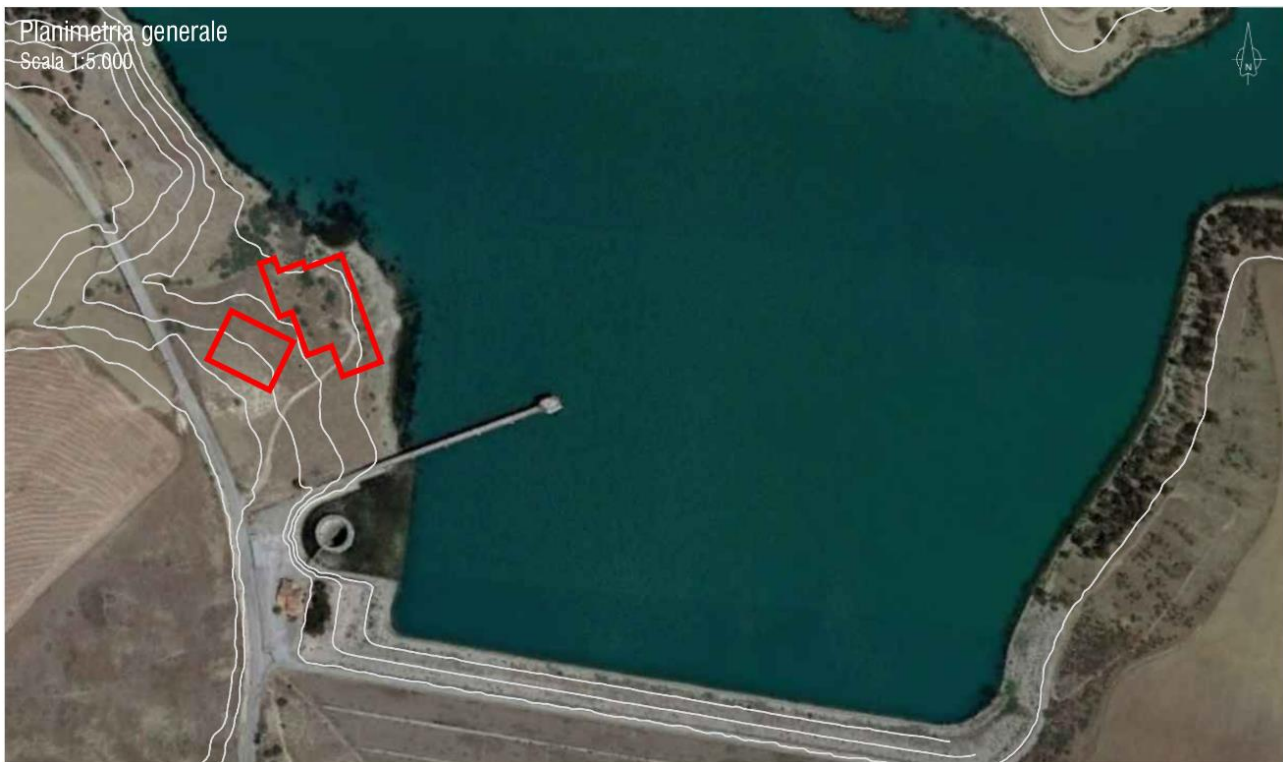
Figura 1: area di intervento