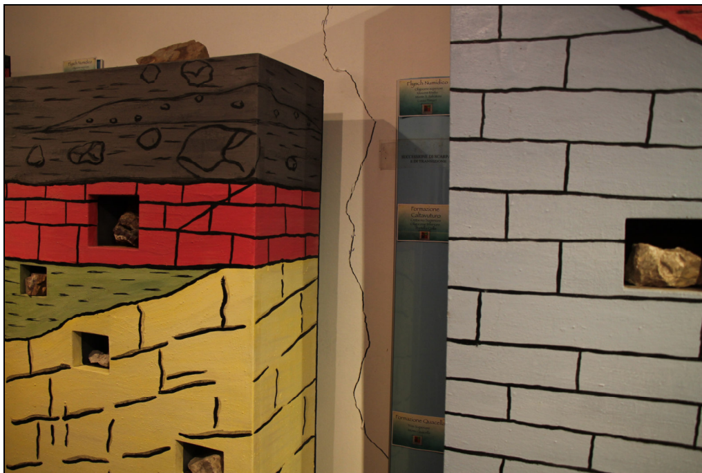
Foto n. 1: dissesto codice 072-6PT-146 (interno Museo civico Collisani)