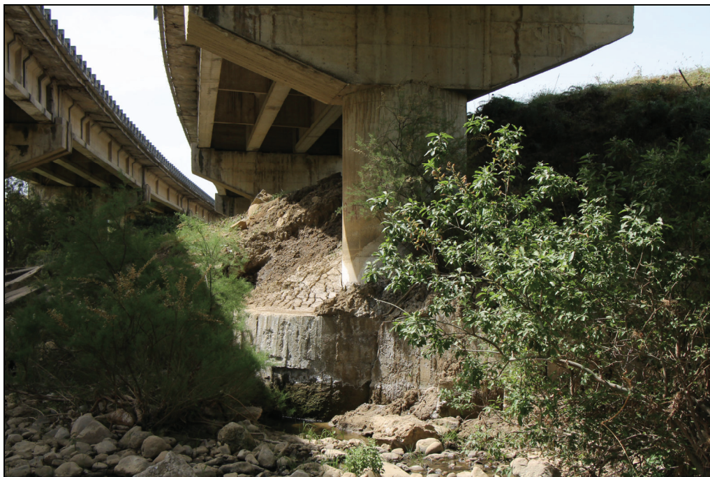
Foto n. 1 – dissesto codice 072-6CE-175 (sopralluogo del 26/05/2022)

Il dissesto, non individuato nel P.A.I. vigente, presenta le caratteristiche di una frana complessa con movimenti rototraslativi nella zona di nicchia evolventi a colamento lento nella parte centrale del corpo di frana fino al piede.