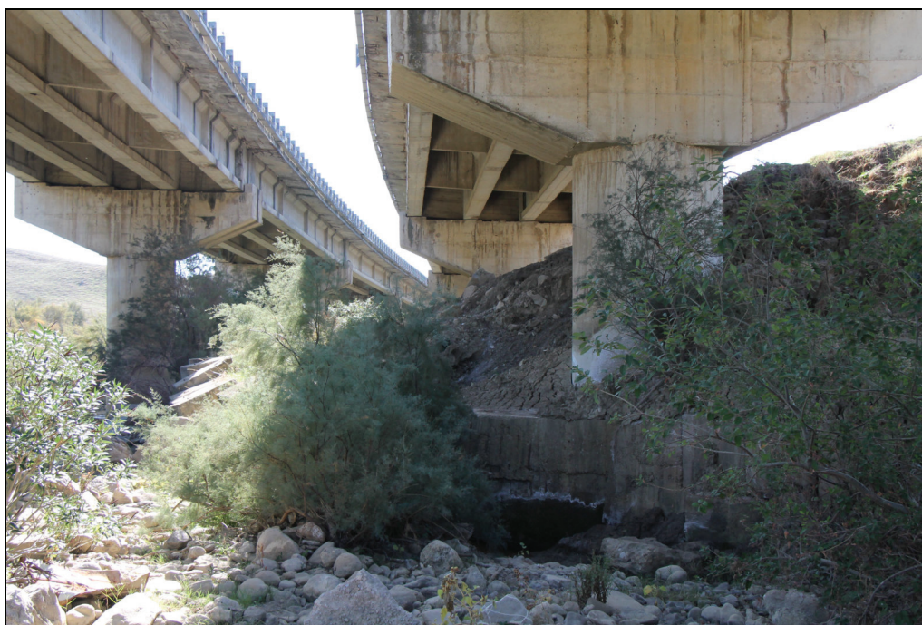
Foto n. 2 – dissesto codice 072-6CE-175 (sopralluogo del 03/11/2022)

A seguito della riunione, su iniziativa del Segretario Generale della Autorità di Bacino si è effettuato un ulteriore sopralluogo, in data 03/11/2022, al quale hanno partecipato anche i rappresentanti del Dipartimento Regionale di Protezione Civile, dal quale è risultato che non è necessario apportare modifiche alla estensione del dissesto 072-6CE-175 rispetto a quanto già rappresentato nella relazione di sopralluogo del 26/05/2022 trasmessa con la nota prot. n. 9484 del 31/05/2022 (Foto n. 2).