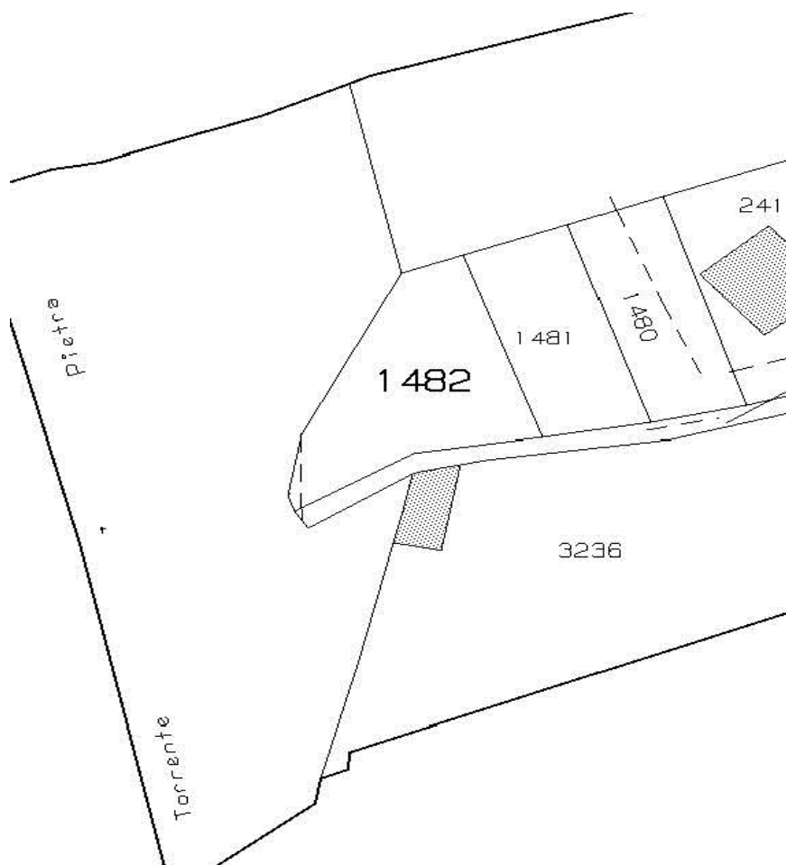
Fig. I - Planimetria generale - Scala 1:500