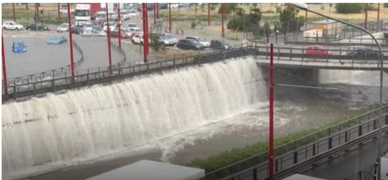
Figura 1 – Evento alluvionale del 15 luglio 2020 – Via Regione Siciliana all'altezza di via Leonardo Da Vinci

Si evidenzia che l'areale di esondazione contenuto nel file kml del Canale Falconara Luparello è meno esteso ed è comunque completamente contenuto nell'areale di esondazione rappresentato nella planimetria relativa all'evento alluvionale del 15 luglio 2020, che come anzidetto al paragrafo 1 è stata trasmessa insieme alla foto indicata in figura 1 dall'Ufficio di Protezione Civile del Comune di Palermo con nota AREAG/72204/2023 del 28/01/2023. Pertanto è proprio questo areale ad essere recepito come Sito di attenzione a cui si assegna il codice identificativo 040-E24.