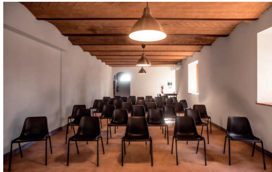
Suvignano: Sala conferenze

Già nel corso dell'estate 2019 molte sono state le visite alla Tenuta; tali visite sono gestite in modo da garantire un'accoglienza ai partecipanti in cui il personale della Società Suvignano o di Ente Terre accolgono i visitatori anche con spiegazioni della storia della Tenuta, delle sue potenzialità e del ruolo della Regione nel contesto della lotta alla criminalità e nel settore agricolo.