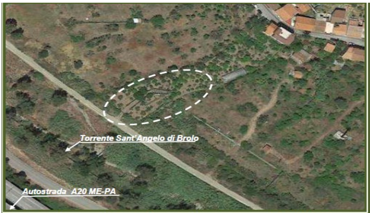
Foto 1. Individuazione del relitto d'alveo (vista da Google Heart del 24/05/2020)

Durante il periodo di pubblicazione del presente avviso l'istanza e la documentazione tecnica che la corredano rimarranno a disposizione del pubblico, previo appuntamento, presso il Dipartimento Regionale Autorità di Bacino, Servizio 7– Pareri e Autorizzazioni Ambientali - Demanio Idrico Fluviale e Polizia Idraulica Messina , sito in Via dei Mille n. 270 - Palazzo del Genio Civile – 98122 MESSINA.