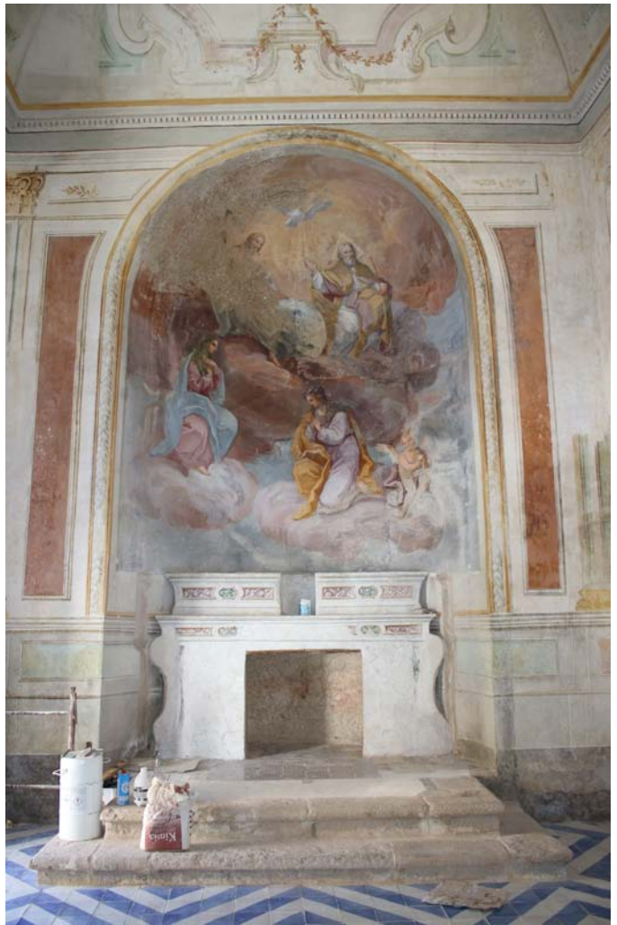
Altare della cappella dedicata a Santa Rosalia