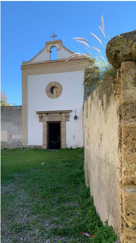
Cappella dedicata a Santa Rosalia