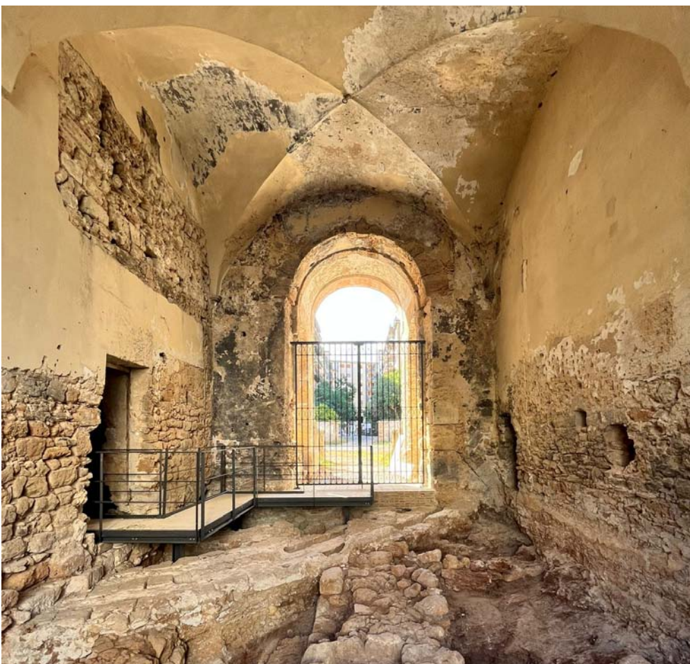
Gli scavi nella Cuba Soprana e la passerella