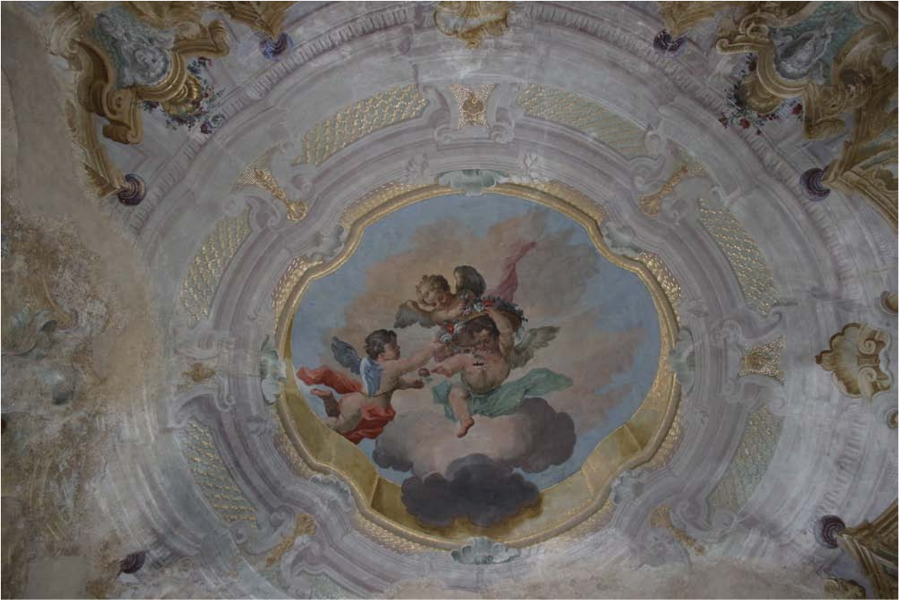
Interno Villa Napoli