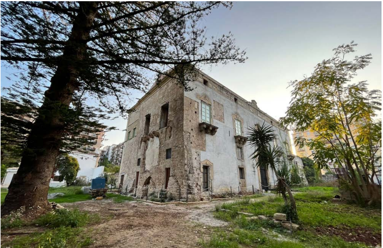
Cuba Soprana - Villa Napoli e il giardino romantico