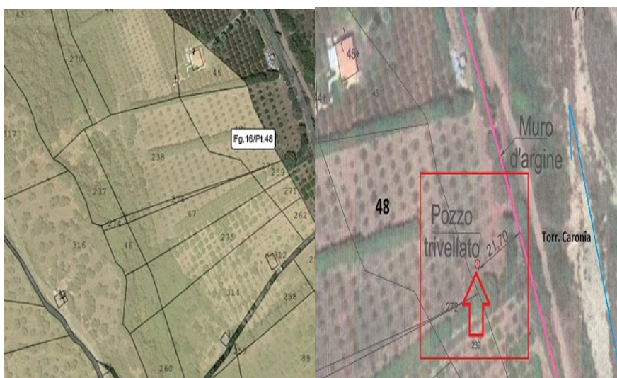
FIG. STRALCIO DELLA MAPPA CATASTALE FG. 16