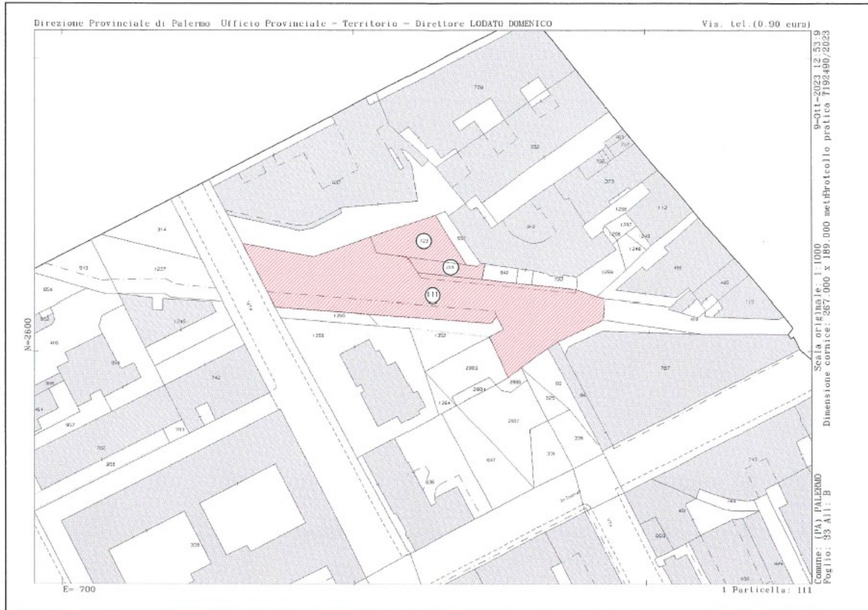
Figura 1: Estratto di mappa Fg 33 Comune di Palermo, particelle 111-723-221.