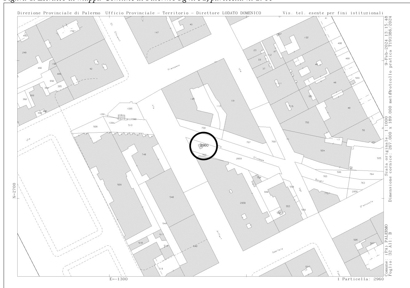
Figura 1: Estratto di mappa Comune di Palermo Fg n. 32, particella n. 2960

Il Dirigente del Servizio 4 del Dipartimento Regionale Autorità di Bacino del Distretto Idrografico della Sicilia rende noto che, con istanza acquisita da questa Autorità con protocollo n. 28314 del 22/11/2023, la Ditta B&G Servizi Rete ed Extra Rete s.r.l. Messina – P.IVA 03412140836, ha presentato istanza di rinnovo della concessione di un'area demaniale afferente al Canale Passo di Rigano, identificata al N.C.E.U. Comune di Palermo al Fg n. 32, p.lla n. 2960, allo scopo di destinarla a impianto di distribuzione carburanti, per un'estensione pari a mq 250,00.