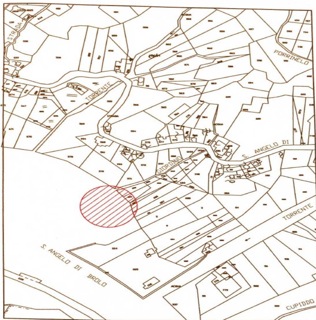
stralcio catastale del foglio di mappa 15