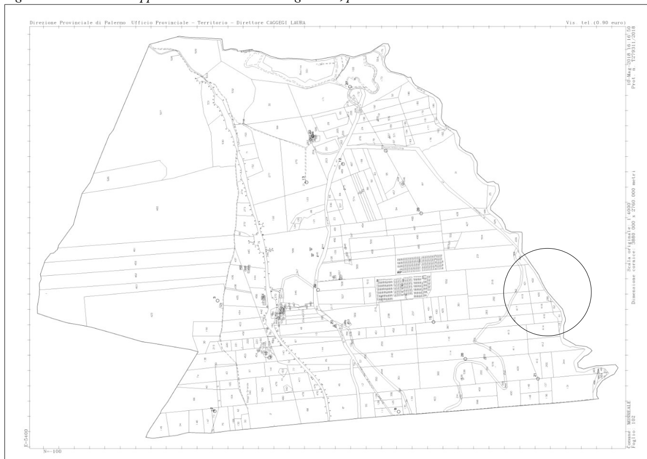
Figura 1: Estratto di mappa Comune di Monreale Fg n. 102, particelle nn. 15-61-62-365-414-416-418-420-422.