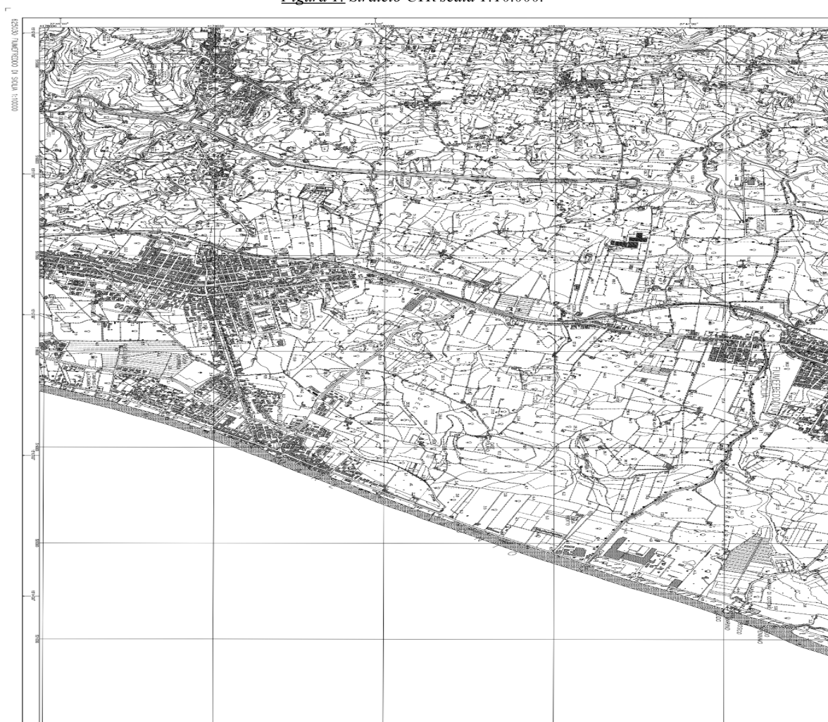
Figura 1: Stralcio CTR scala 1:10.000.