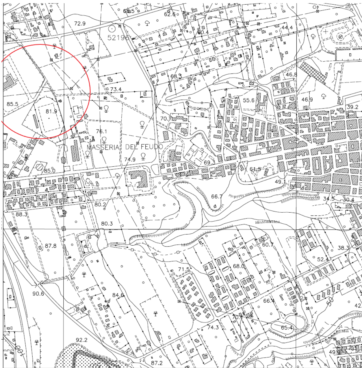
Figura 1: Stralcio CTR 646030 Priolo Gargallo (SR) scala 1:10.000.

Il Dirigente del Servizio 6 del Dipartimento Regionale Autorità di Bacino del Distretto Idrografico della Sicilia rende noto che, con istanza acquisita da questa Autorità con protocollo n. 13095 del 22/05/2024, la Società Snam Rete Gas S.p.A con sede legale in Piazza Santa Barbara, 7 San Donato Milanese (MI), P.I./C.F. 10238291008, ha presentato l'istanza di concessione per uso metanodotto nel relitto d'alveo del torrente "CAVA CANNIOLO" per l'opera in progetto denominata "Rifacimento allacciamento ERG raffinerie DN 300 (12'') – DP 24 bar" – ricadente nel territorio del Comune di Priolo Gargallo (SR), consistente nella realizzazione di una nuova linea di trasporto gas-metano avente lunghezza 2,275 km a sostituzione della condotta esistente denominata "Met. ERG Raffinerie DN 300 (12'') MOP 24 bar" di lunghezza pari a 2,175 km.