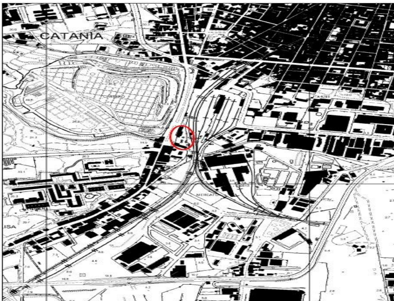
Figura 2: Stralcio mappa catastale territorio Zia Lisa nel comune di Catania.