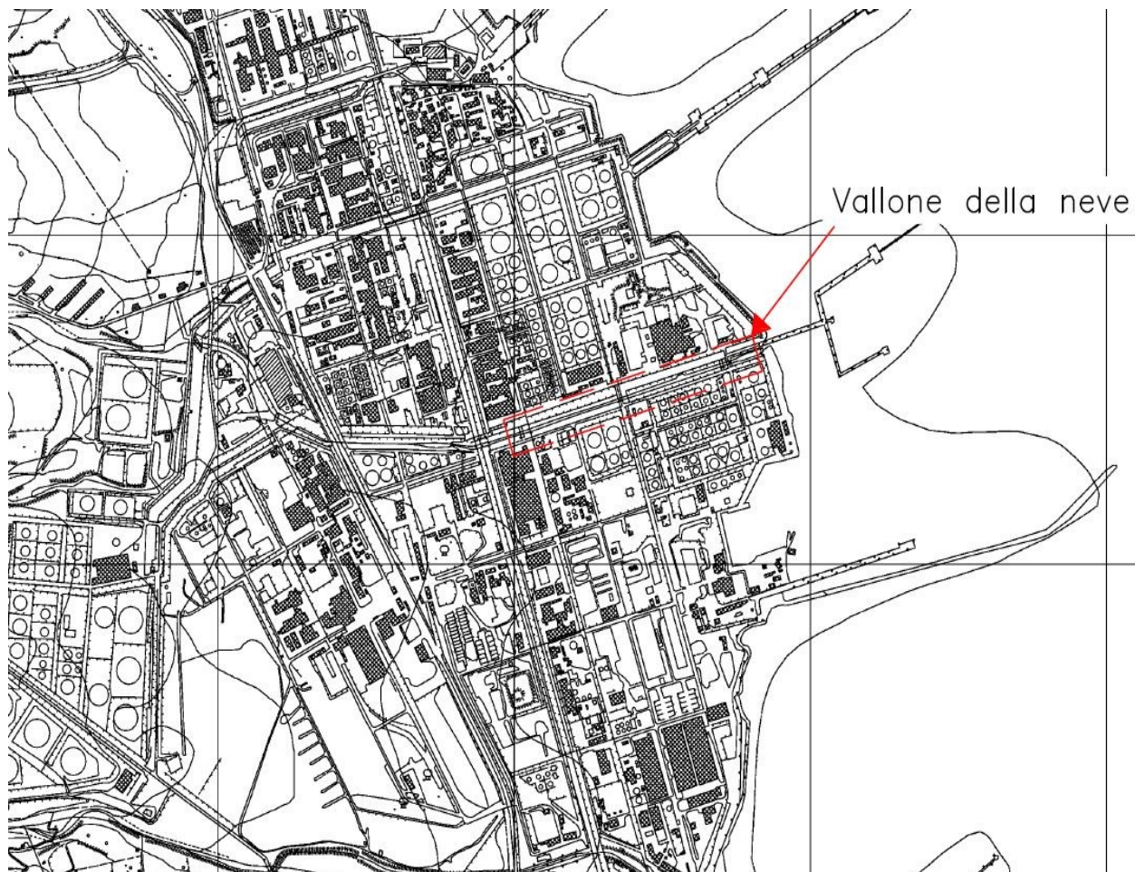
Figura 2: Stralcio mappa catastale foglio di mappa n. 60 part. 898 Comune di Priolo Gargallo