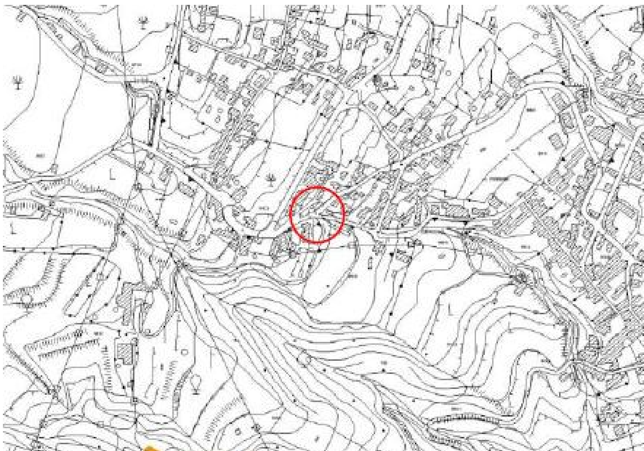
Figura 2: Stralcio mappa catastale foglio 24 part.ile 217 e 277 Territorio nel comune di Sant'Alfio (CT)