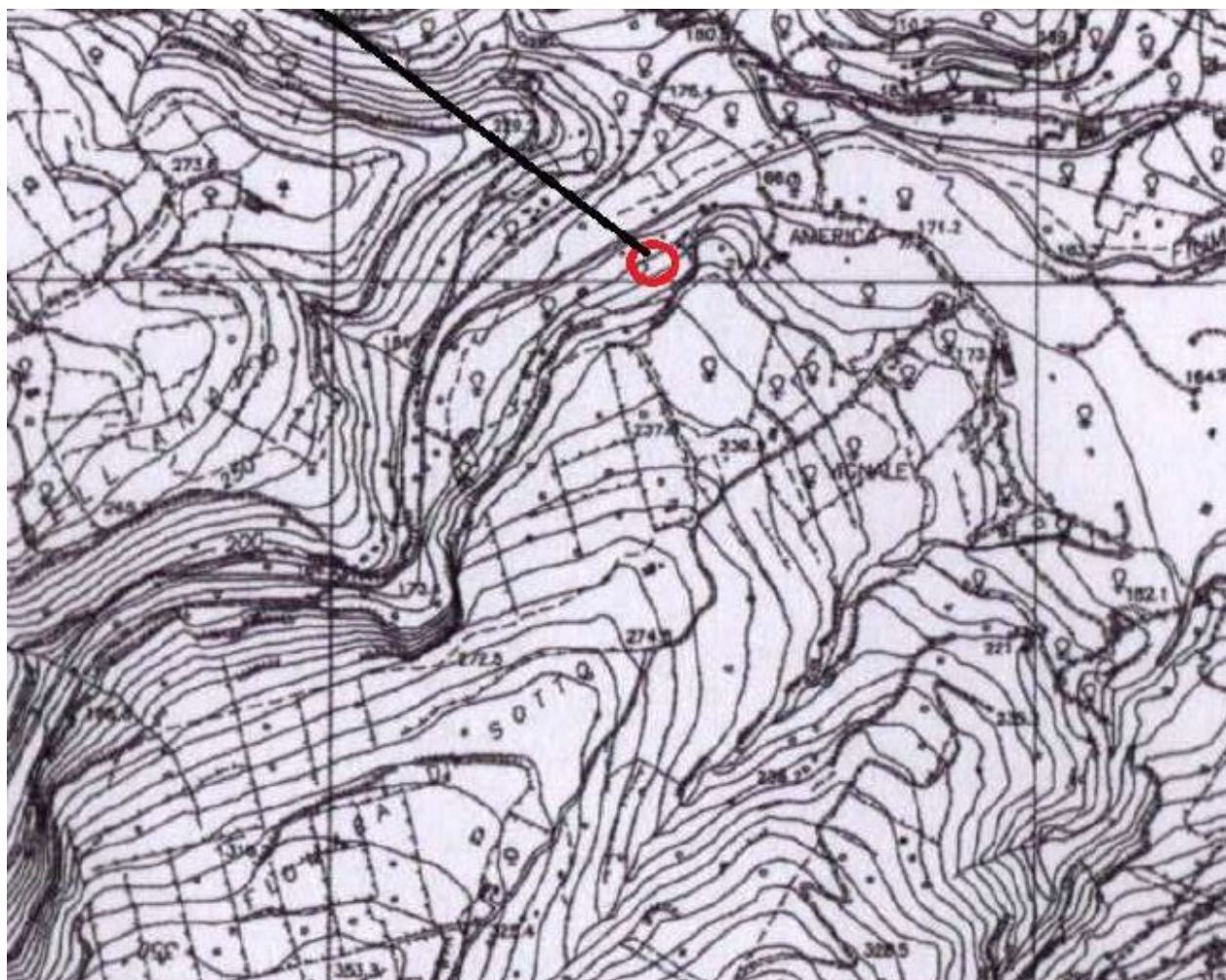
Figura 1: Stralcio CTR scala 1:10.000. Sezione 646050 Pantalica