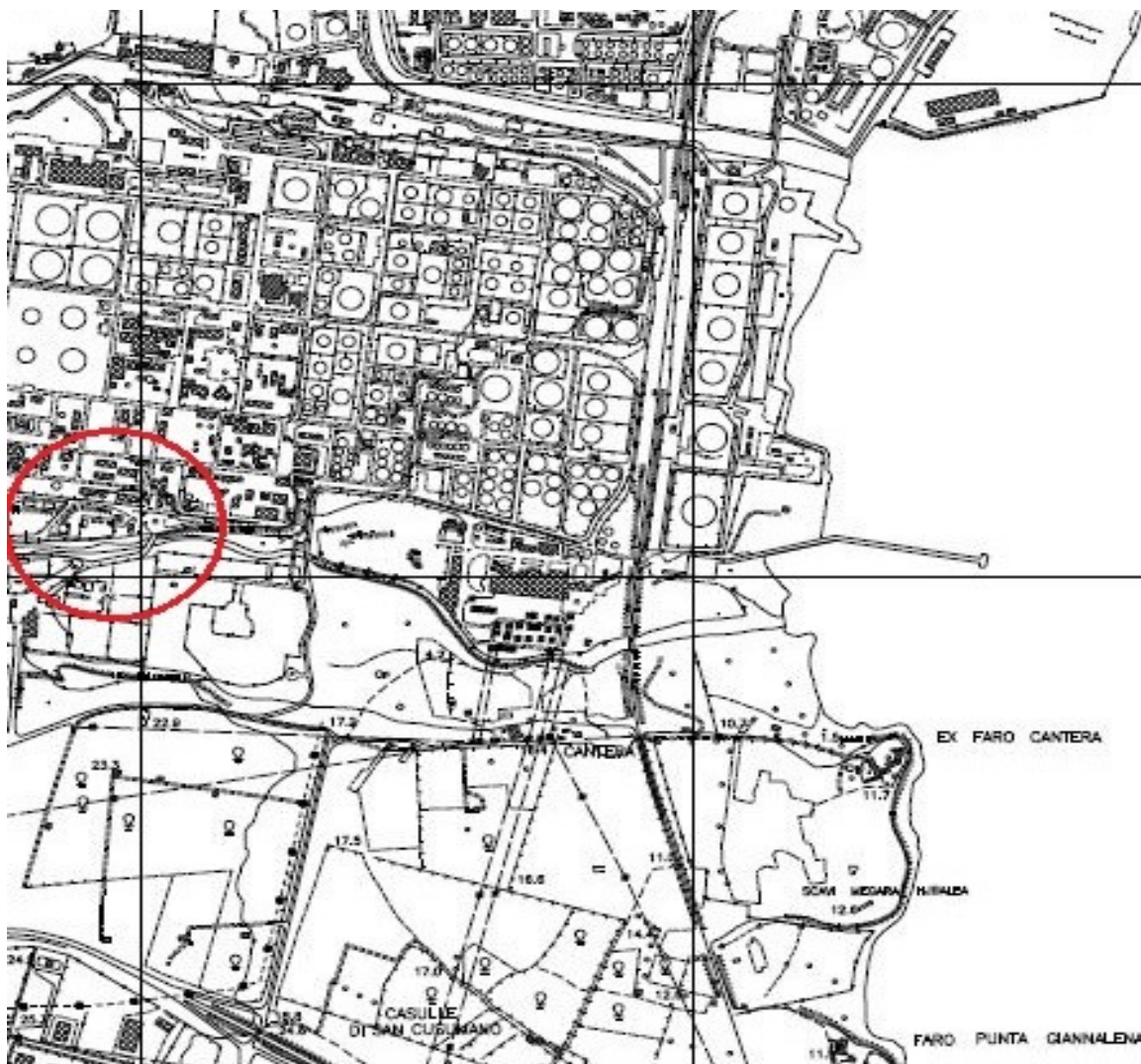
Figura 2: Stralcio mappa catastale foglio di mappa n. 83 part. 98 nel territorio del Comune di Augusta e Foglio di mappa n. 40 P.lla 175 nel territorio del Comune di Melilli.