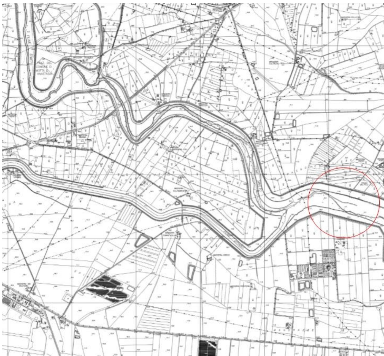
Figura 1: Stralcio CTR scala 1:10.000. Sezione 633160 Territorio nel comune di Catania (CT)

Il Dirigente del Servizio 6 del Dipartimento Regionale Autorità di Bacino del Distretto Idrografico della Sicilia rende noto che, con istanza acquisita da questa Autorità con protocollo n. 20085 del 05/08/2024 e protocollo n. 20086 del 05/08/2024 la Società BIG FISH SPV Srl , con sede legale in Viale Monza, 259 - 20126 Milano (MI), P.I./C.F. 10796040961, per il rilascio di una Concessione per occupazione e utilizzo di aree del Demanio Idrico, ricadente nel comune di Catania, afferenti a Fiume Simeto. L'istanza è relativa ad un attraversamento per mq.285 denominato "AT SUD 2" , di cavidotto elettrico per un impianto fotovoltaico della potenza di circa 256,54 MWp e relativo sistema di accumulo integrato della potenza e capacità di accumulo pari a 20 MW.