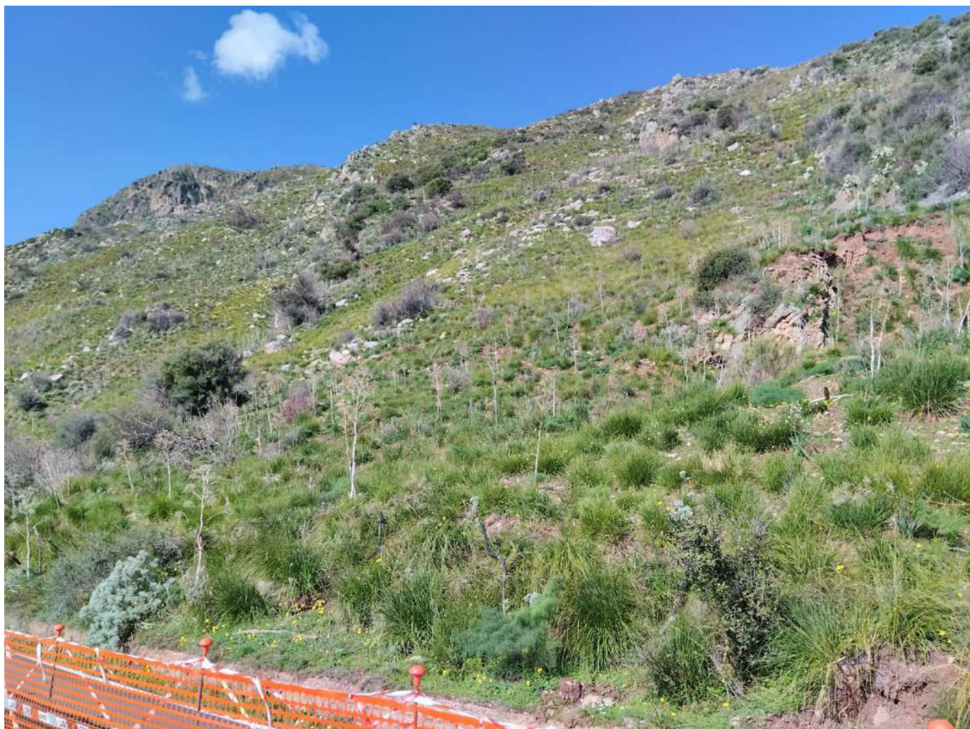
Foto 2. Particolare versante