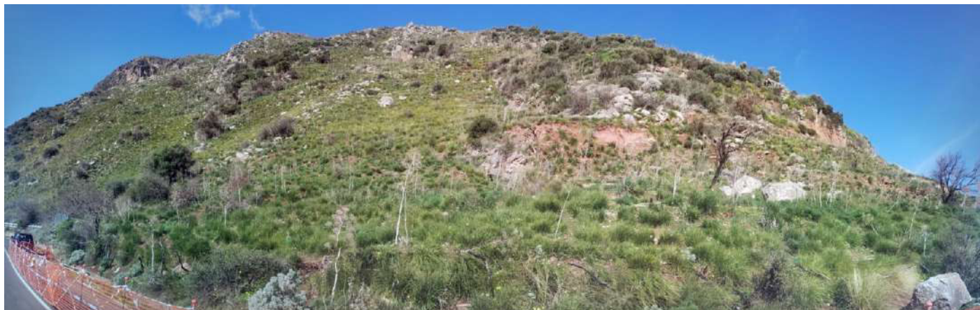
Foto 1. Panoramica versante

Nel corso del sopralluogo del 29/02/2024 si è effettivamente constatato che il versante a monte della sede stradale è caratterizzato da diversi fronti rocciosi, posti a varia quota, che rappresentano aree sorgenti di crollo, così come evidenziato dalle foto successive. Ciò testimoniato dalla presenza di diversi blocchi, già staccatisi, distribuiti lungo tutto il versante anche a valle della strada provinciale.