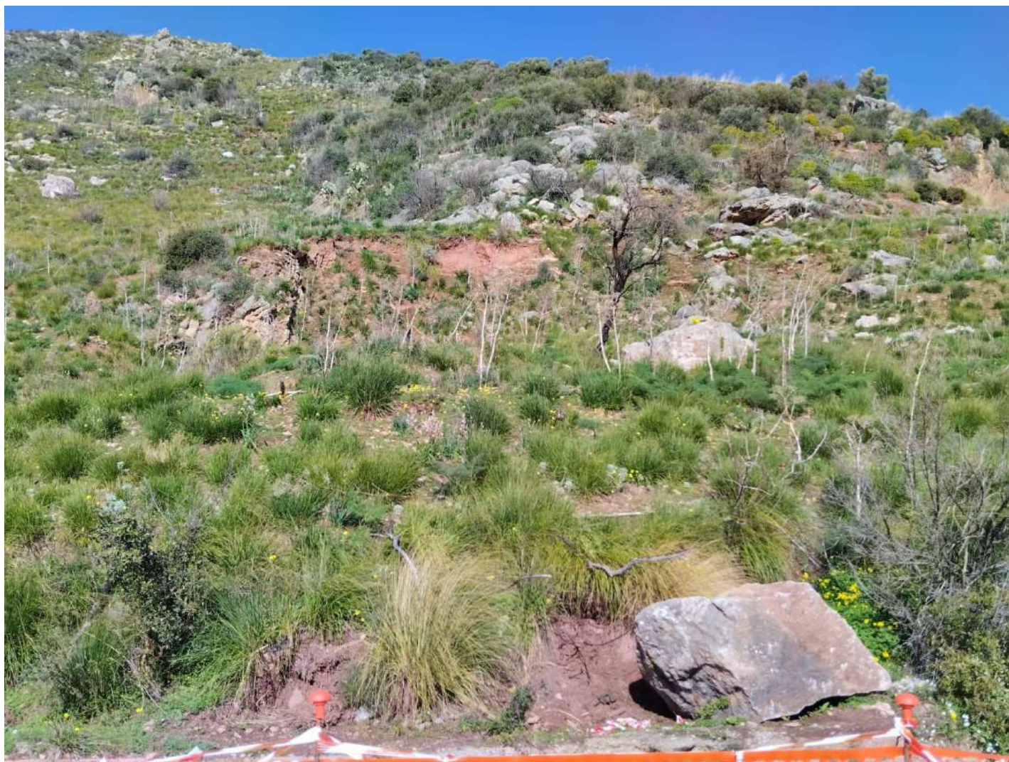
Foto 3. Particolare versante.

In primo piano il masso crollato spostato dalla sede stradale successivamente al crollo