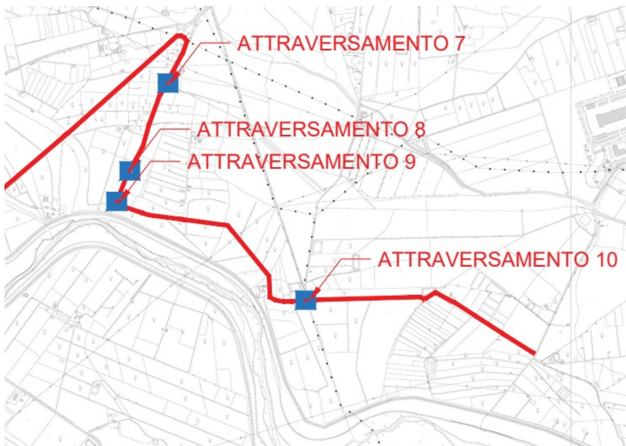
Figura 1: Stralcio CTR scala 1:10.000. Sezione 633160 Territorio nel Comune di Catania (CT)

Afferenti a corsi d'acqua ricadenti nel Comune di Catania (CT), nell'ambito della progettazione, realizzazione ed esercizio di un impianto fotovoltaico denominato "Sardella" della potenza di 38000 kW in A.C. e 46067,20 kWp in d.C. con sistema di accumulo integrato e di tutte le opere connesse ed infrastrutture da realizzarsi nei Comuni di Belpasso (CT) in C.da Finocchiaro e Catania.