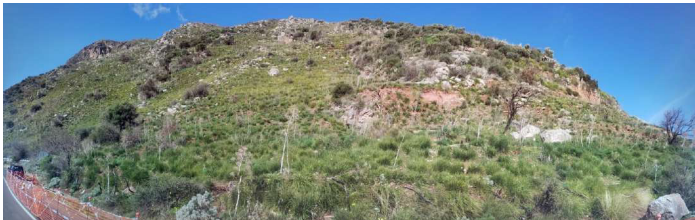
Foto 1. Panoramica versante

Nel corso del sopralluogo del 29/02/2024 si è effettivamente constatato che il versante a monte della sede stradale è caratterizzato da diversi fronti rocciosi, posti a varia quota, che rappresentano aree sorgenti di crollo, così come evidenziato dalle foto successive. Ciò testimoniato dalla presenza di diversi blocchi, già staccatisi, distribuiti lungo tutto il versante anche a valle della strada provinciale.