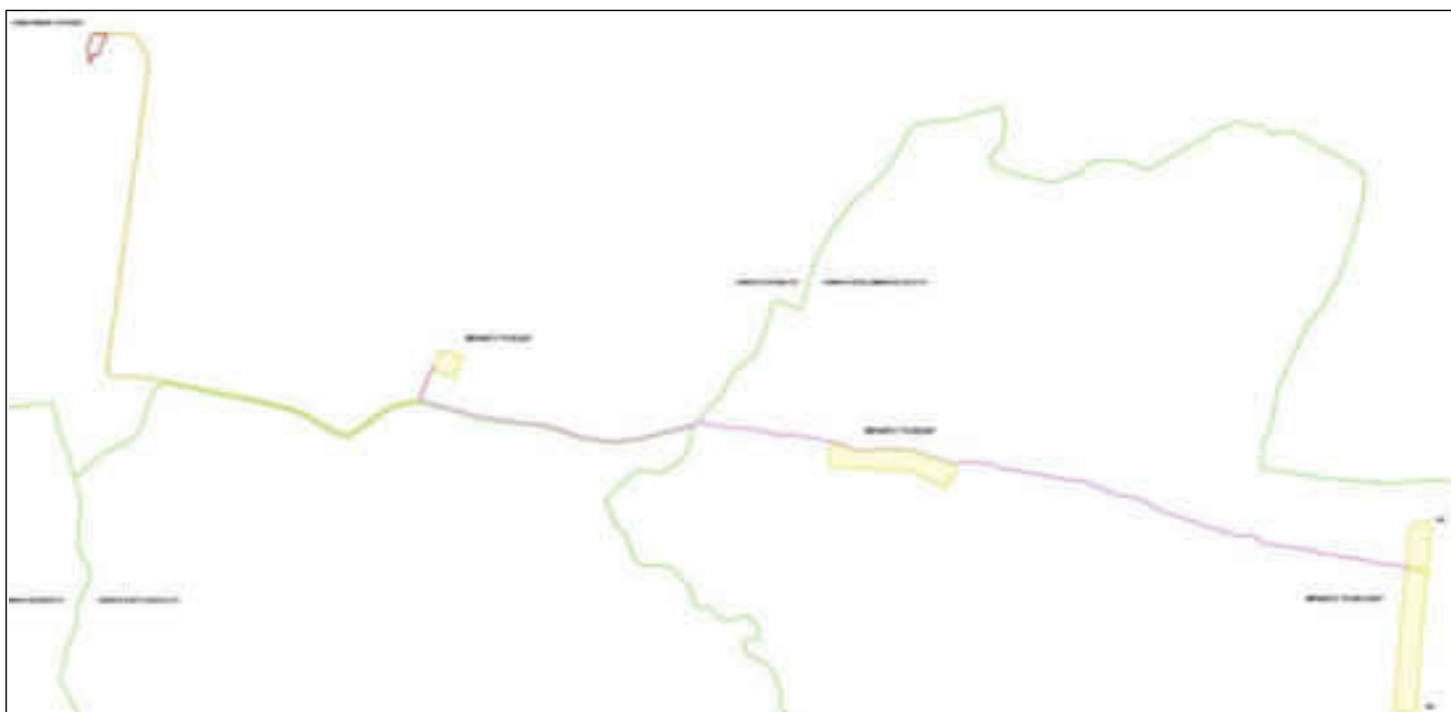
Figura 1. Schema generale impianto