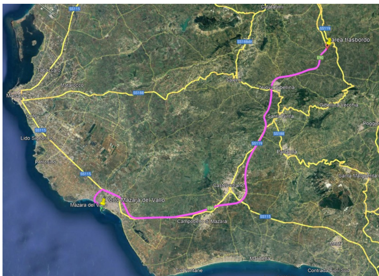
Figura 1.4: ipotesi di viabilità di accesso al sito (linea magenta)

Questa ipotesi dovrà essere analizzata in fase di progettazione esecutiva da una società specializzata in trasporti speciali. (Figura 1.4).