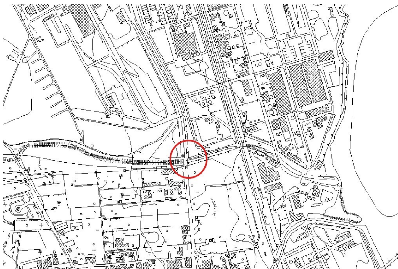
Figura 1: Stralcio CTR scala 1:10.000 – Sezione n. 646030 – Comune di Priolo Gargallo (SR)

Il Dirigente del Servizio 6 del Dipartimento Regionale Autorità di Bacino del Distretto Idrografico della Sicilia rende noto che, con istanza acquisita da questa Autorità con protocollo n. 23264 del 04/09/2025, la ditta B2G Sicily S.r.l. , con sede legale a Genova, Via Trento n. 43/2 – Partita IVA 01669090894, ha presentato l' istanza di concessione per l'occupazione e l'utilizzo di aree del Demanio idrico finalizzata agli interventi previsti per la verifica e il ripristino di un cavo elettrico in media tensione (M.T.), destinato all'alimentazione della rete pozzi Sud, di proprietà della B2G Sicily Srl ; il cavo in oggetto è posato sotto la sede stradale della Strada Provinciale ex SS-114 Litoranea Priolese, nel tratto corrispondente all'attraversamento del torrente Canniolo, nei pressi dell'abitato di Priolo Gargallo (SR) .