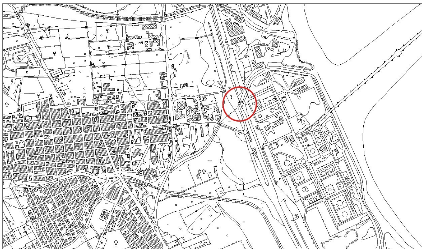
Figura 1: Stralcio CTR scala 1:10.000 – Sezione n. 646030 – Comune di Priolo Gargallo (SR)

Il Dirigente del Servizio 6 del Dipartimento Regionale Autorità di Bacino del Distretto Idrografico della Sicilia rende noto che, con istanza acquisita da questa Autorità con protocollo n. 21796 del 07/08/2025, la ditta Sonatrach Raffineria Italiana S.r.l. , con sede legale in Milano , Via Alessandro Manzoni n. 38 – Partita IVA 10410680960, ha presentato l' istanza di rinnovo della concessione per l'occupazione e l'utilizzo di aree del Demanio idrico finalizzata all' attraversamento del Vallone Priolo ad opera di un fascio tubiero che costeggia il vallone in sinistra idraulica, per un primo tratto fuori terra e per un secondo tratto all'interno di un cunicolo in cls il quale, a sua volta, attraversa il corso d'acqua in subalveo, per una lunghezza di 180 m. Tale fascio tubiero è costituito da n. 3 tubazioni aventi diametri pari a 10", 6" e 4", che mettono in collegamento la Sonatrach Raffineria Italiana con il Deposito NATO, la Versalis e la Air Liquide.