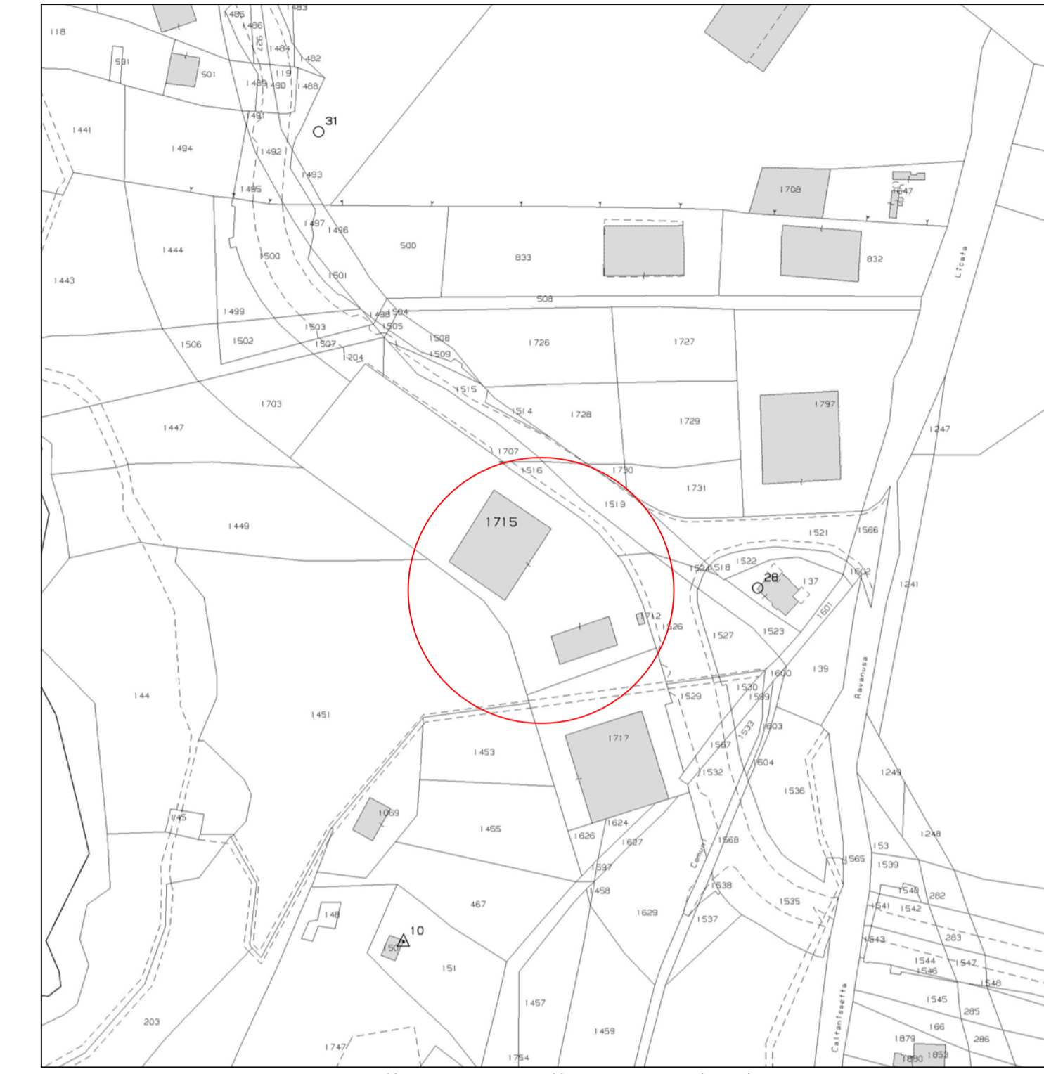
Estratto di mappa Foglio 172 - Caltanissetta Scala 1:2000