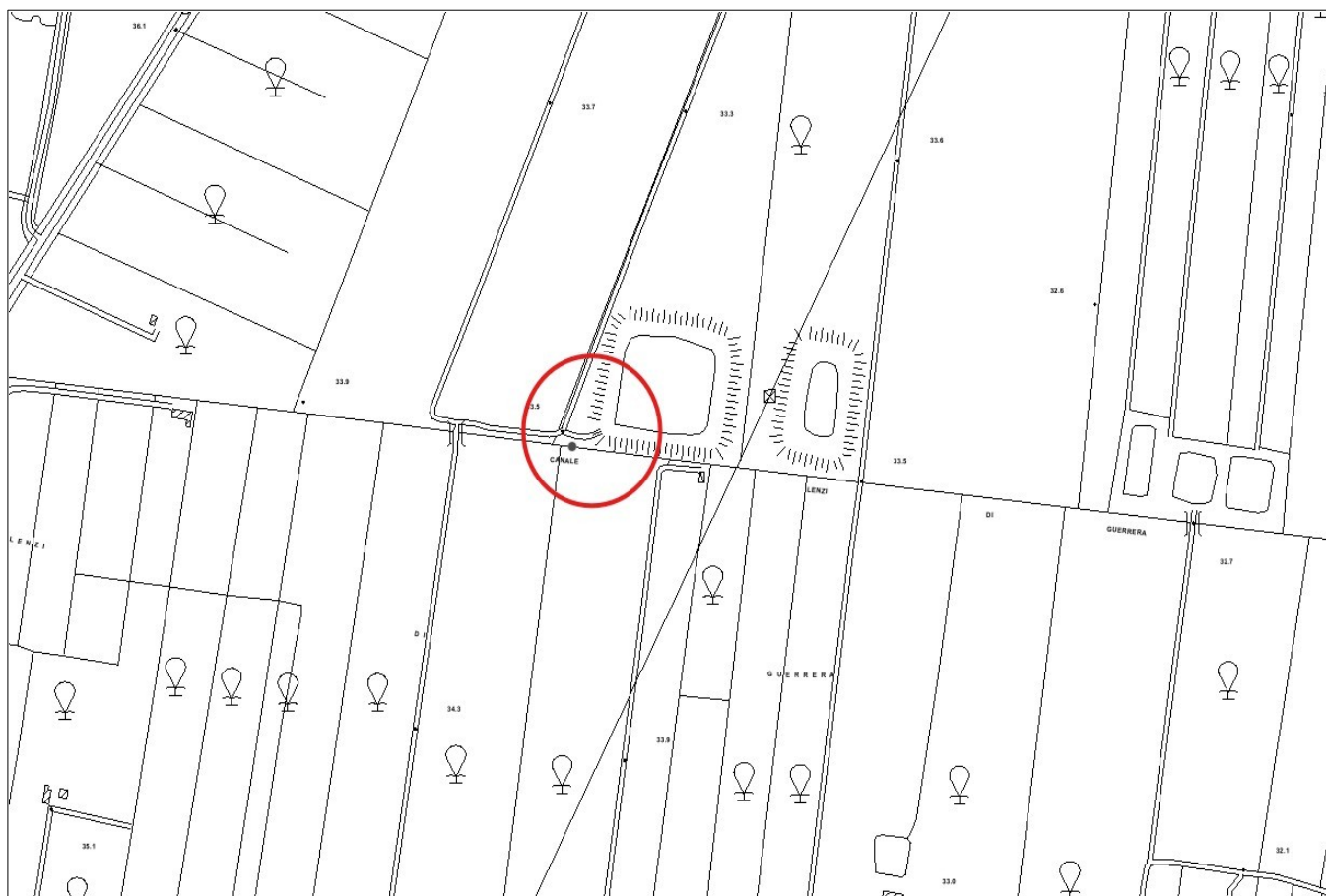
Figura 1: Stralcio CTR scala 1:10.000 – Sezione n. 633150 – Comune di Belpasso (CT)

Il Dirigente del Servizio 6 del Dipartimento Regionale Autorità di Bacino del Distretto Idrografico della Sicilia rende noto che, con istanza acquisita da questa Autorità con protocollo n. 11409 del 14/04/2025, la ditta RES COMPANY SICILIA S.r.l. , con sede legale ad Agrigento, Via Imera n. 201 – Partita IVA 03062400845, ha presentato l'istanza di concessione per l'occupazione e l'utilizzo di aree del Demanio idrico finalizzata agli interventi per realizzazione di un cavidotto interrato AT a 36 kV di collegamento tra l'impianto di accumulo elettrochimico (BESS) da realizzarsi in località "Lenzi di Guerrera" in territorio comunale di Belpasso (CT) con la sezione a 36 kV connesso con la stazione elettrica (SE) RTN 380/150/36 kV anch'essa ricadente in territorio comunale di Belpasso e attraversamento del "Canale Lenzi di Guerrera" tramite T.O.C. .