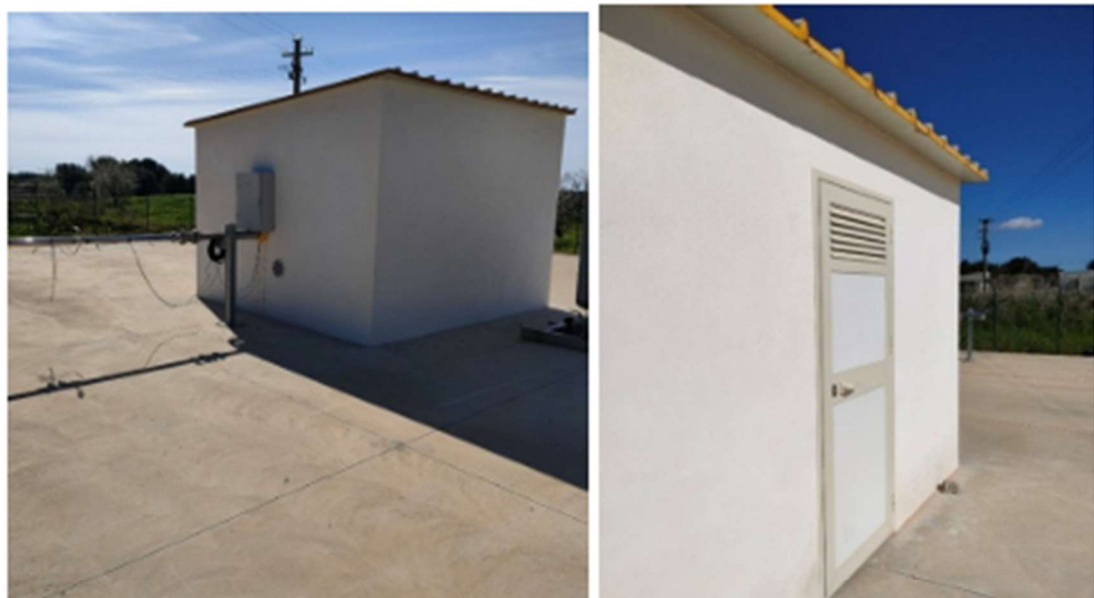
Figura 18- Struttura di protezione del pozzo