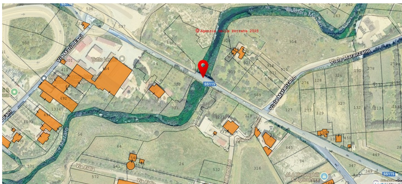
Figura 1: Comune di Mazara del Vallo (TP) lat. 37,67462° long. 12,58503°

Il Dirigente del Servizio 4 del Dipartimento Regionale Autorità di Bacino del Distretto Idrografico della Sicilia rende noto che, con istanza acquisita da questa Autorità con protocollo n. 21615 del 5/08/2025, la Ditta GREENERGY RINNOVABILI 2 SRL C.F./P.I. 11892510964 ha presentato istanza di concessione di n. 2 aree demaniali, per opere di connessione alla RTN mediante dorsale MT di un impianto fotovoltaico, ubicate nel Comune di Mazara del Vallo (TP).