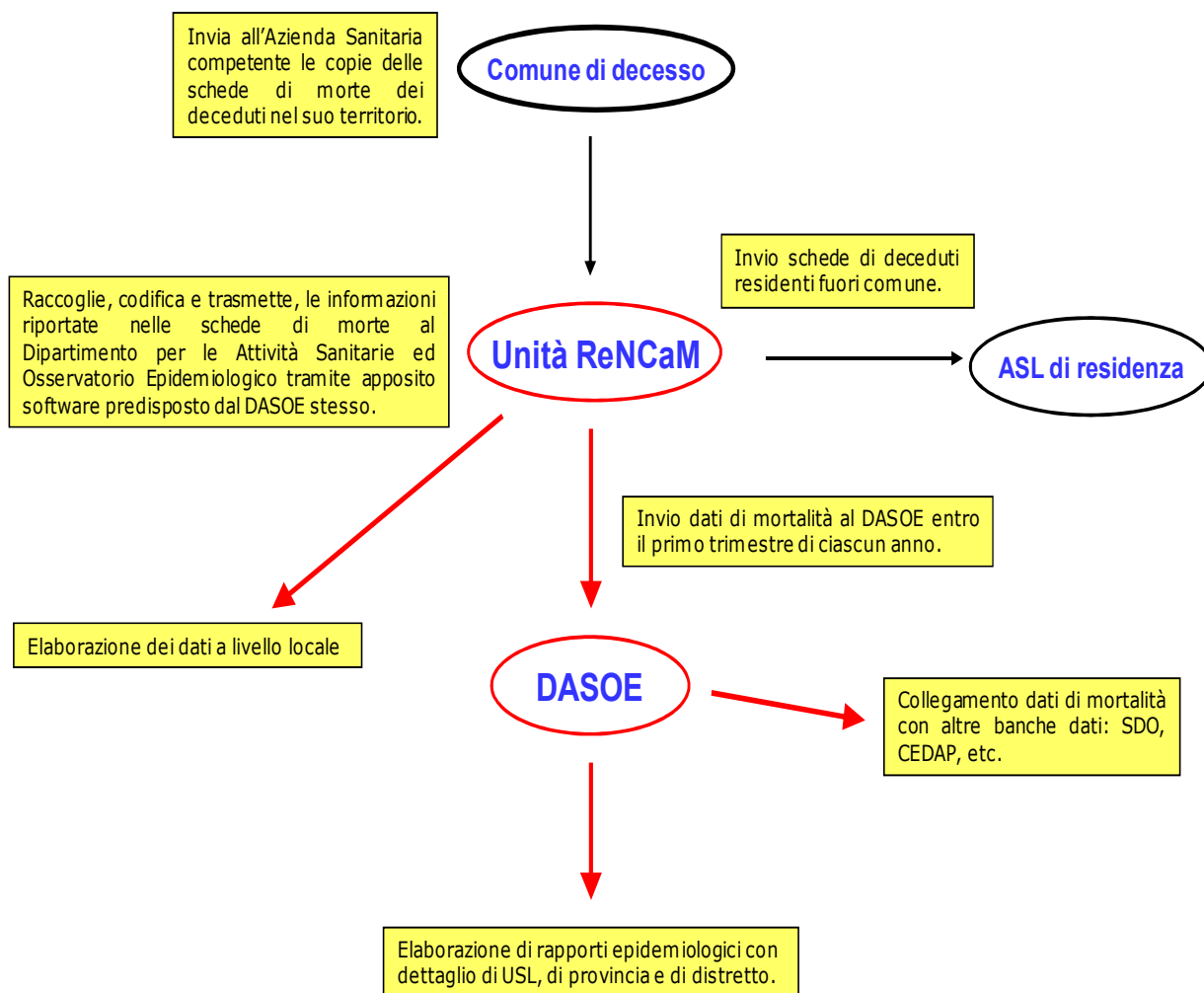
Figura 4. Organizzazione e funzionamento del sistema di rilevazione dei dati di mortalità in Sicilia