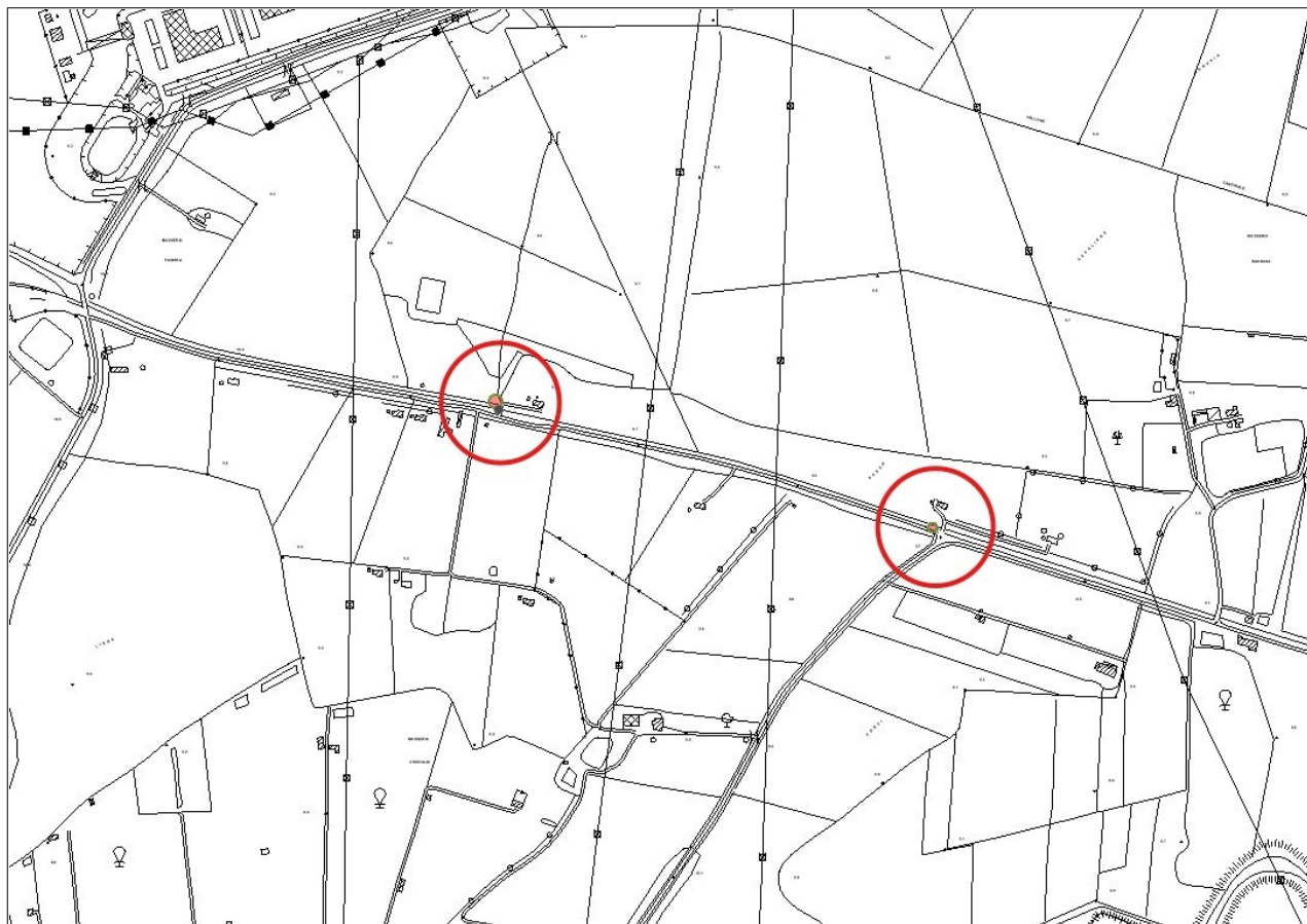
Figura 3: Stralcio mappa catastale Fg. 65 Partt. 178 e 194 - Territorio del Comune di Catania