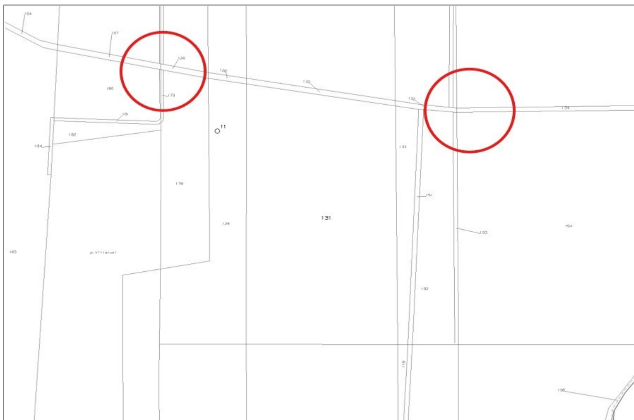
Figura 4: Stralcio mappa catastale Fg. 46 Partt. 123 e 442 - Territorio del Comune di Catania