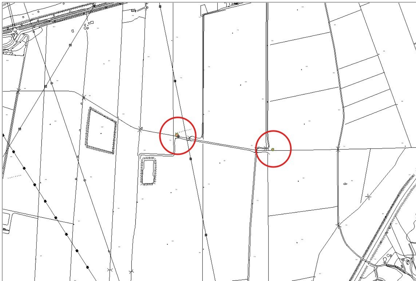
Figura 1: Stralcio CTR scala 1:10.000 – Sezione n. 641010 – Comune di Catania

Il Dirigente del Servizio 6 del Dipartimento Regionale Autorità di Bacino del Distretto Idrografico della Sicilia rende noto che, con istanza acquisita da questa Autorità con protocollo n. 34204 del 17/12/2025, la ditta SOLAR ENERGY TREDICI S.r.l. , con sede legale a Bolzano, Sebastian Altmann n. 9 – Partita IVA 03058810213, ha presentato l'istanza di concessione per l'occupazione e l'utilizzo di aree del Demanio idrico finalizzata a due tombature realizzate con scatolari in calcestruzzo e due attraversamenti in TOC, di corsi d'acqua senza denominazione, rispettivamente alle coordinate 37.382361 N – 15.0169 E, 37.381721 N - 15.022491 E, 37.43197 N - 15.016289 E e 37.433673 N – 15.008521 E (Foglio 65, partt. 178 e 194 – Foglio 46, partt. 123 e 442) in territorio del Comune di Catania.