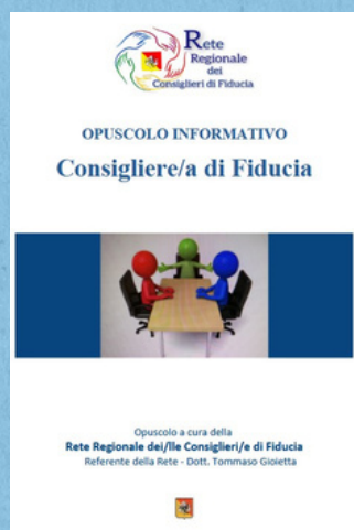
Opuscolo Consigliere di fiducia

D.Lgs. 215/2003 e 216/2003 - Divieto di discriminazione razziale, religiosa, sessuale: Attuazione Regolamento UE 2000/43/CE e 2000/78/CE Antidiscriminazione in UE