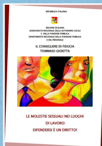
Opuscolo Le molestie sessuali nei luoghi di lavoro