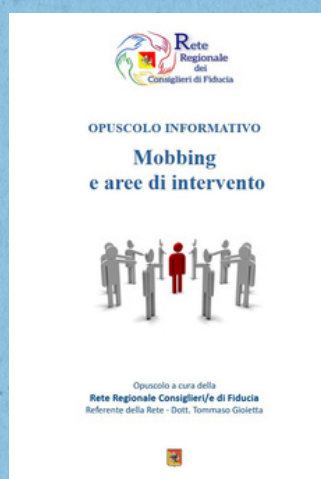
Opuscolo Informativo Mobbing e aree di intervento